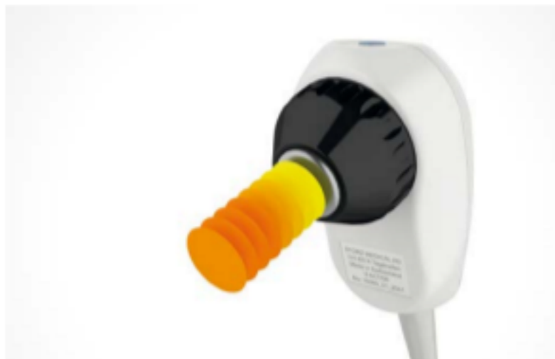
L'applicatore per vibrazioni V-ACTOR®