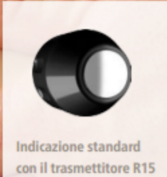
Indicazione standard con il trasmettitore R15