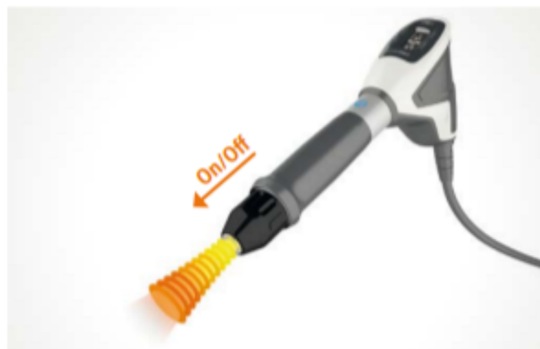
Applicatore con funzione »Skin Touch«

Per l'applicatore radiale »FALCON«, STORZ MEDICAL ha sviluppato una serie di trasmettitori di impulsi concepiti per trattare un ampio spettro di indicazioni per la terapia a onde d'urto radiali. Per i trasmettitori vengono utilizzati esclusivamente materiali che corrispondono alle più recenti conoscenze nel campo della ricerca e ottimizzano la trasmissione dell'energia delle onde d'urto nella zona dolente.