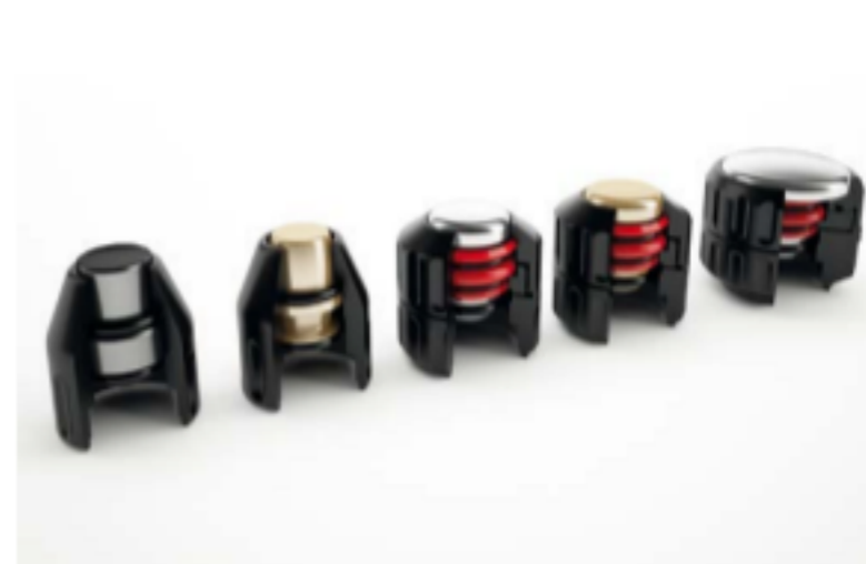
Vari trasmettitori per il trattamento individuale delle più diverse indicazioni