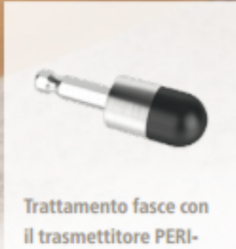
Trattamento fasce con il trasmettitore PERI-