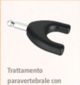
Trattamento paravertebrale con