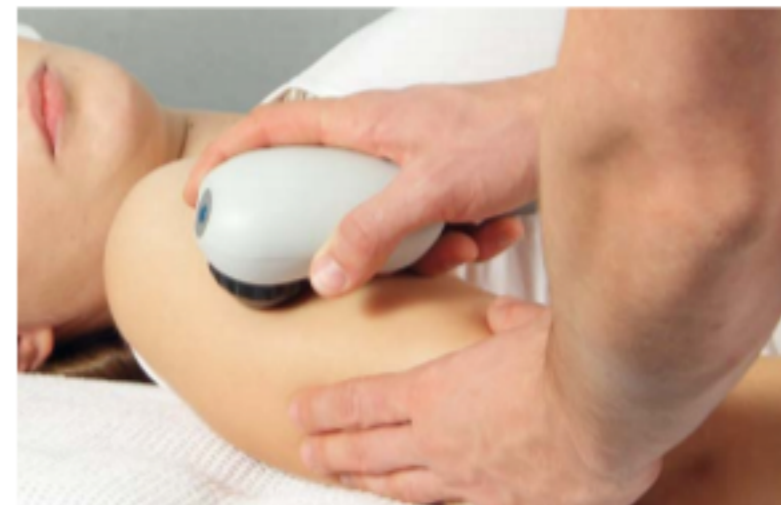
Terapia con vibrazioni per le contratture muscolari nella parte superiore del braccio